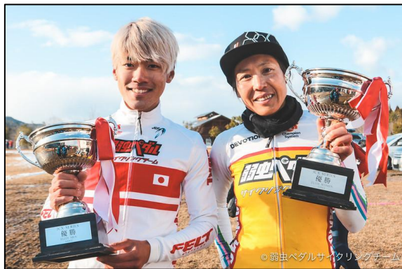
JCX 最終戦スチールの森京都

有限会社バイ・ティー・ジェイ 〒466-0044 名古屋市昭和区桜山町1-15 052-851-0221 www.vittoriajapan.co.jp info@vittoriajapan.co.jp